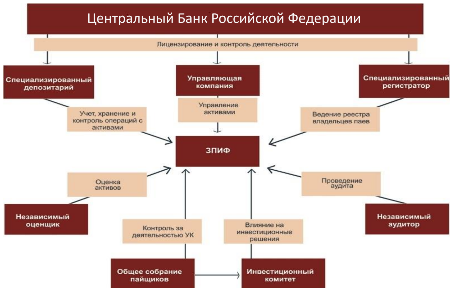
Схема функционирования Закрытого Паевого Инвестиционного Фонда